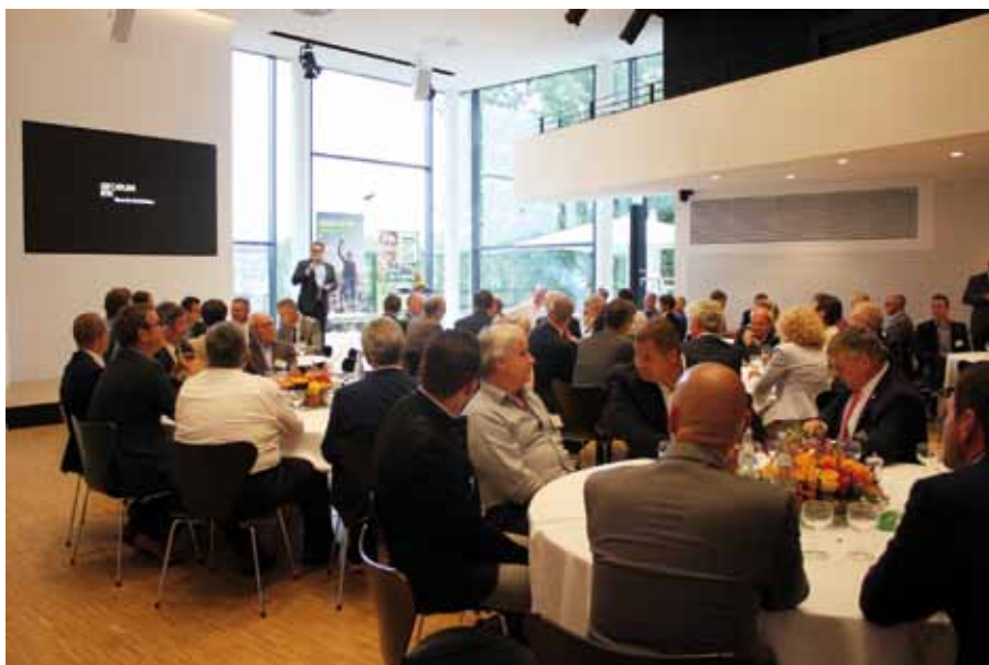
Mehr als 25 Landtagsabgeordnete folgten der Einladung zum Parlamentarischen Abend der Gartenbauverbände.