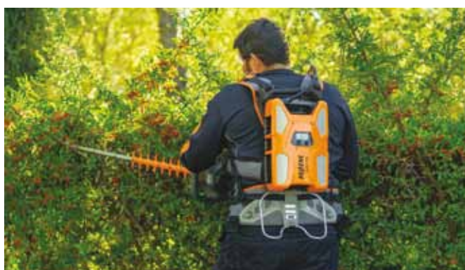
Bestens versorgt: Mit dem Akku in der ergonomisch optimierten Rückentragung bleibt man flexibel und mobil in der Grünpflege.

Wenn in der Politik derzeit über Dieselverbot in Innenstädten diskutiert wird, drängt sich die Frage auf, ob der Verbrennungsmotor überhaupt noch eine Zukunft hat. Der französische Maschinenspezialist Pellenc konzentriert sich als weltweit erster Hersteller bereits seit über 15 Jahren voll auf akkubetriebene Geräte für GaLaBau-Profis und setzt konsequent auf Lithium-Ionen-Technologie. Die Vorteile von Akkugeräten liegen auf und in der Hand: deutlich leisere Motoren bis hin zur Befreiung von Gehörschutz und spürbar geringere physische Belastungen des Maschinenführers. Durch den Wegfall des Kraftstoffs entfallen direkte CO 2 -Emissionen und die Maschinen sind ungleich wartungsärmer und damit wesentlich kostengünstiger im Betrieb. Dazu sind sie auf Knopfdruck einsatzbereit und erlauben mobiles und flexibles Arbeiten in jedem Gelände. Die Wirtschaftlichkeit von Akkugeräten kann man leicht selbst berechnen: eine Akkuladung zum Beispiel für den Pellenc ULiB 1500 schlägt mit rund 0,43 Euro zu Buche (für 1,5 kWh). Damit lassen sich Handgeräte mit Profi-tauglicher Leistung schon einen Arbeitstag lang betreiben. Geräte mit Verbrennungsmotor verbrauchen im gleichen Zeitraum rund 5 Liter Sonderkraftstoff im Wert von rund 15 Euro. Eine klare Ersparnis, mit der sich vor allem die leistungstärksten Pellenc-Geräte am schnellsten amortisieren.