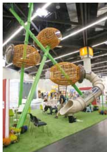
Rund 150 Aussteller aus dem im Segment Spielplatz erwartet die Nürnberg-Messe zur GaLaBau 2018.