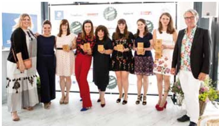
In der „Sturmfreien Bude“ in Düsseldorf wurde zum zweiten Mal der Garden & Home Blog Award verliehen. Alle Siegerinnen freuten sich über die Auszeichnung.