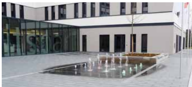
Zahlreiche Formate und Oberflächenvarianten bietet das neue Primavera Pflaster- und Plattensystem.