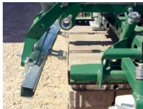
Hunklinger bietet jetzt eine exklusive Lösung zum Verschieben von verschiebesicheren Steinen an.

Jetzt steht es fest: Hunklinger bekam das Patent erteilt für eine „Formsteinverlegevorrichtung mit zeitlich versetzter Verschiebung von Formsteinreihen“. „Wir sind sehr stolz darauf, unseren Kunden eine exklusive Lösung zum Verschieben von verschiebesicheren Steinen anzubieten“, so