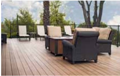
Die Terrassendielen verando vereinen die Haptik und Optik von Tropenholz in einem pflegeleichten Material.