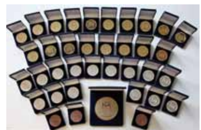
Bei den gärtnerischen Wettbewerben auf der IGA 2017 gingen zahlreiche Auszeichnungen an die Küpper Blumenzwiebeln & Saaten GmbH.

Die Küpper Blumenzwiebeln & Saaten GmbH in Eschwege führt mit das größte Sortiment an Blumenzwiebeln in Deutschland. Bei der IGA Berlin 2017 gingen zwei der höchsten Auszeichnungen an Küpper. Die Große Goldmedaille der Deutschen Bundesgartenschau-Gesellschaft, ebenso den Bundesehrenpreis in Gold