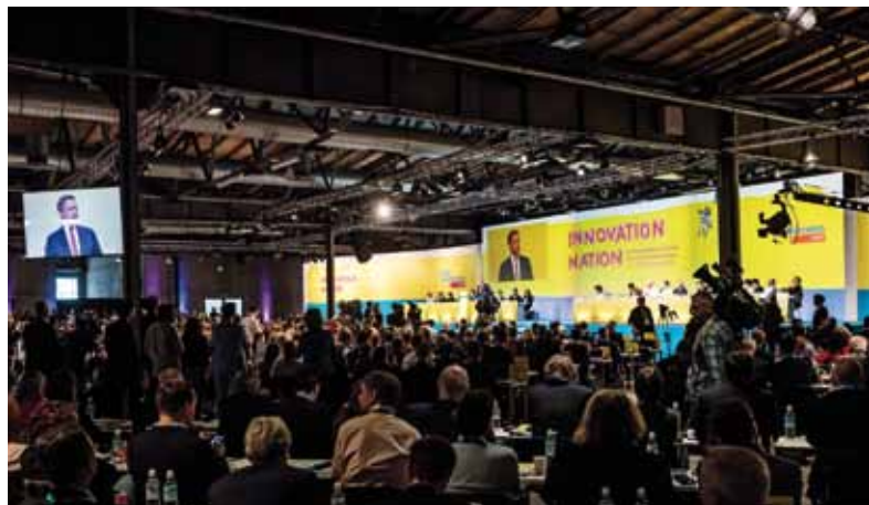
In der STATION in Berlin Kreuzberg fand der 69. Bundesparteitag der FDP statt. Unter dem Motto INNOVATION NATION trafen sich die Delegierten der 16 Landesverbände.