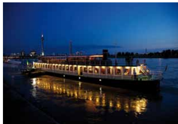
Parlamentarischer Abend auf der MS Riverstar in Düsseldorf.

So stellten sie unter anderem die Initiativen „Grün in die Stadt“, „Rettet den Vorgarten“ und den Förder-Check für kommunale Grünprojekte vor, um in diesem Rahmen die Politik dazu aufzurufen, der Bedeutung von Stadtgrün entsprechende Mittel bereitzustellen. Zum Ausbau der Studienmöglichkeiten über einen einzelnen Standort in NRW hinaus plädierten die Verbände für die Unterstützung, einen weiteren Studiengang des Landschaftsbaus am Standort Wuppertal einzuführen. Um eine Initiative für gute Ausbildung zu fördern, soll zudem eine gezielte interministerielle Landesinitiative für gute Ausbildung im Handwerk und Garten- und Landschaftsbau gefördert werden. Auch das Bestreben, im Sinne des Instruments „Teilhabe für alle“ eine stärkere Verknüpfung zum 1. Arbeitsmarkt zu schaffen, war den Verbänden ein wichtiges Anliegen.