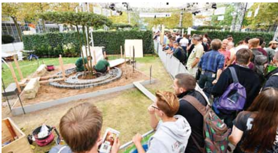
Beim bundesdeutschen „Landschaftsgärtner-Cup“ zeigen die Auszubildenden ihr Können. Das Deutsche Meisterteam qualifiziert sich für die Teilnahme an den Berufsweltmeisterschaften „WorldSkills“, die 2019 in Kazan ausgetragen werden.

„Bauen mit Grün“ gewürdigt. Die ELCA (European Landscape Contractors Association) fördert seit einigen Jahren in Kooperation mit dem BGL das Zusammenwirken aller Beteiligten in Planung und Bauausführung von ökologisch ausgerichteten Bauwerken einschließlich der Gestaltung ihrer Begrünung und Außenanlagen. Richtungsweisende Leistungen bei der Planung und Ausführung werden mit dem Internationalen ELCA-Trendpreis „Bauen mit Grün“ ausgezeichnet. In diesem Jahr wird ein Projekt aus den Niederlanden mit der begehrten Auszeichnung des europäischen Branchenverbandes prämiert.