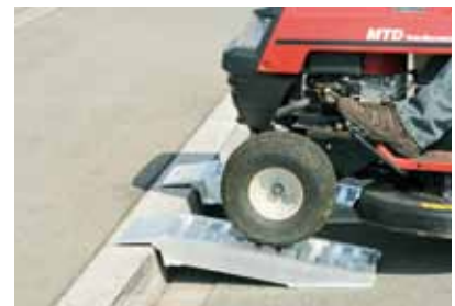
Mit den Kurzrampen von Altec lassen sich Bordsteine leicht überwinden.

Kleine Stufen, Bordsteine oder Aufkantungungen können für fahrbare Arbeitsgeräte bereits ein Hindernis darstellen. Der Verladetechnikhersteller Altec aus Singen bietet mit den Kurzrampen eine solide und dauerhafte Lösung, um diese Höhendifferenz einfach und sicher zu überwinden. Die Kurzrampen wurden