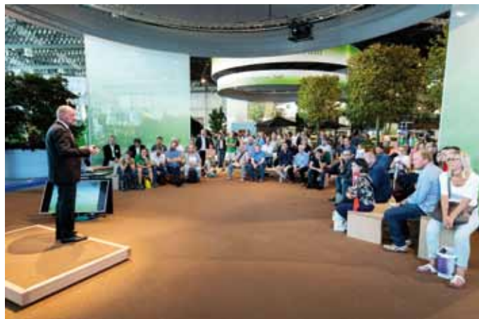
Das 2016 auf der GaLaBau 2016 erfolgreich eingeführte GaLaBau Experten-Forum wird auch im neuen Garten [T]Räume Areal wieder ein zentraler Anlaufpunkt für das Fachpublikum werden.