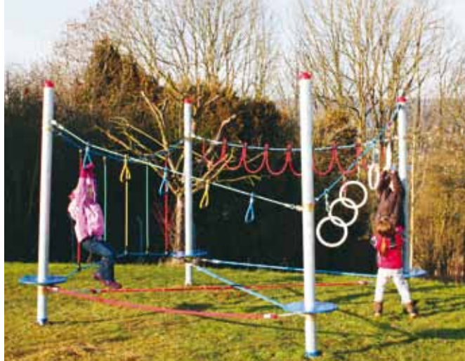
Der Slackmaster bietet mit der Kombination von Balancier- und Hangelementen Spielspaß, Training und Abenteuer.