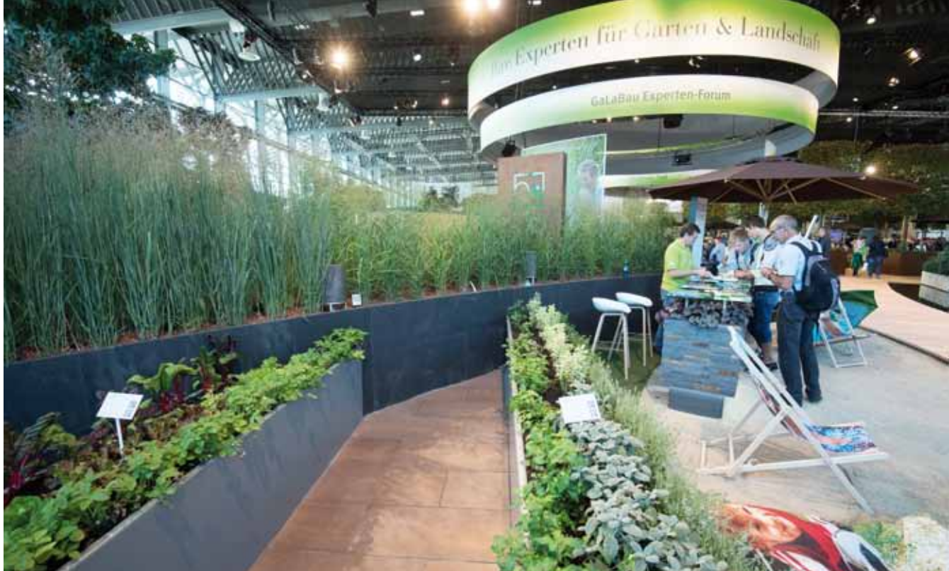
Der BGL-Messestand ist ein beliebter Treffpunkt für die Fachbesucher der GaLaBau 2018.