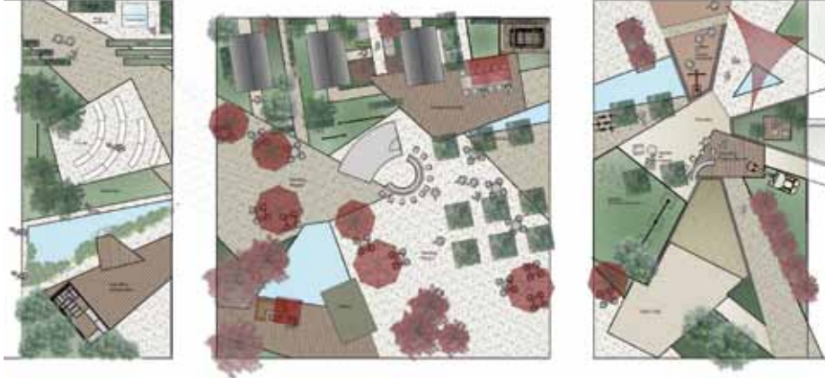
Planung für die Garten[T]Räume in Halle 3A

auf den Bereich Bau, Pflege und Management von Golfanlagen spezialisiert haben. In Halle 4A wartet einmal mehr der „Meeting Point Golf“.