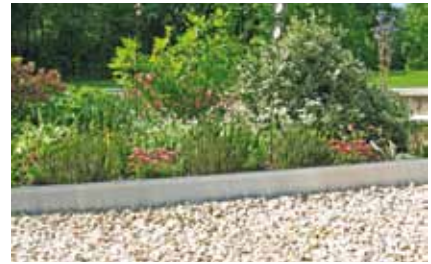
Gartenprofil PRO harmonisiert besonders gut mit dem aktuellen Trend zu minimalistischem Design.