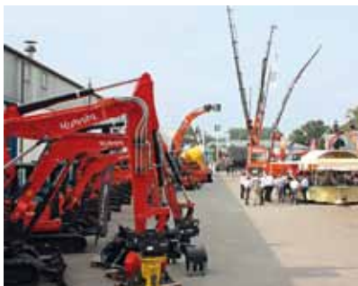
Über Baumaschinen und Lkw-Aufbauten informierten sich Besucher beim Tag der Offenen Tür.

Bei hochsommerlichen Temperaturen konnten sich kürzlich mehrere hundert Fachbesucher und interessierte Gäste ein Bild vom Angebotsspektrum der Firma Michels in Geldern machen. Am Firmensitz in der Max-Planck-Straße bot sich ein spektakuläres Bild, welches von Baumaschinen und Lkw-Aufbauten bestimmt wurde. Michels beschäftigt derzeit 120