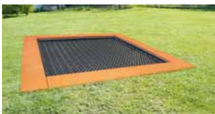
Hally-Gally Trampoline gibt es nun auch in der komfortablen Größe von 3 x 3 m.

Seine Trampoline bietet Hally-Gally nun auch in der komfortablen Größe von 3 x 3 m an – mit viel Platz zum Springen – in bewährter Ausführung mit geräuscharmer, rutschhemmender Recycling-Gummimatte mit abgedeckten Federn.